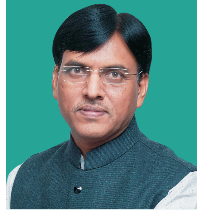
डॉ मनसुख मंडाविया Dr. Mansukh Mandaviya

To strive to seek to find and not to yield