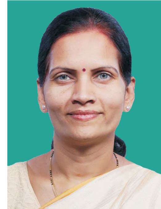
डॉ भारती प्रवीण पवार Dr. Bharati Pravin Pawar

माननीय केंद्रीय मंत्री / Hon'ble Union Minister स्वास्थ्य एवं परिवार कल्याण मंत्रालय / Ministry of Health & Family Welfare